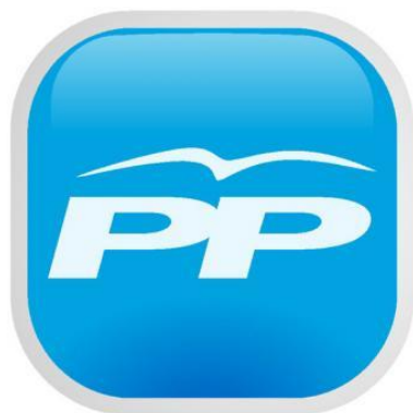
Partido Popular (PP)